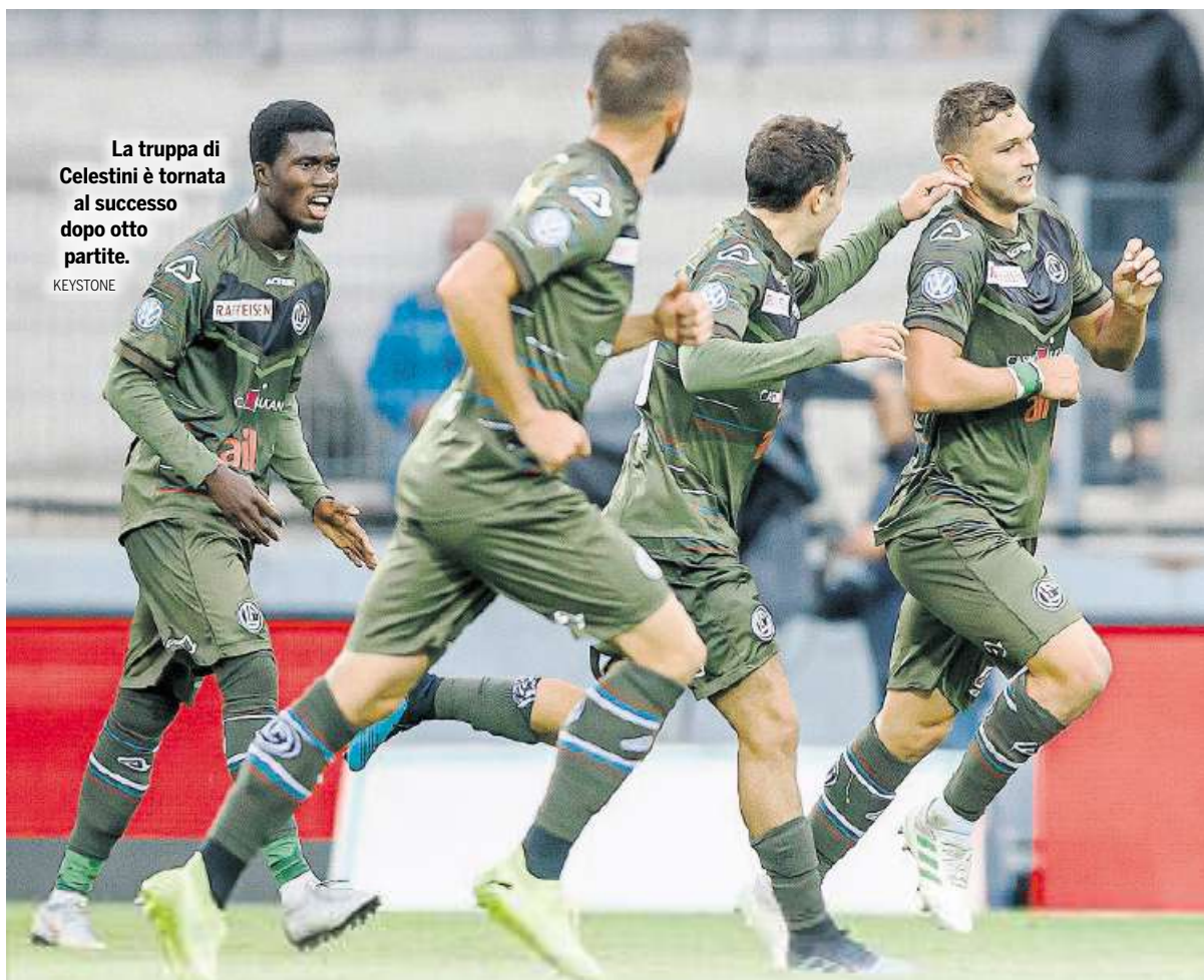
La truppa di Celestini è tornata al successo dopo otto partite.

LUGANO. Durante le recenti vacanze estive il roaming dati è letteralmente esploso. È l'effetto delle offerte comprendenti la navigazione illimitata all'estero, lanciate all'inizio di quest'anno dai vari operatori di telefonia mobile. In Portogallo la fruizione di dati da parte dei clienti Swisscom è per esempio cresciuta del 300%. Ma l'operatore non ci perde? Pagina 7