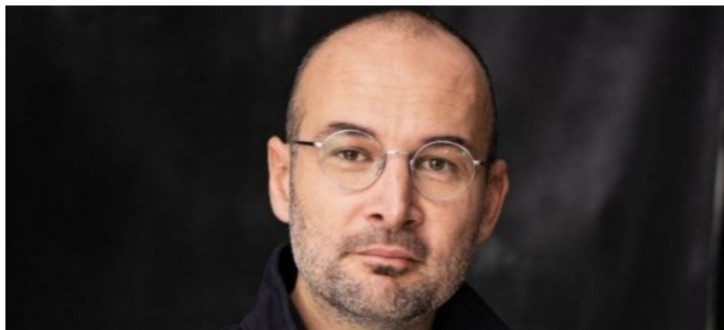
Festival Diritti Umani Lugano