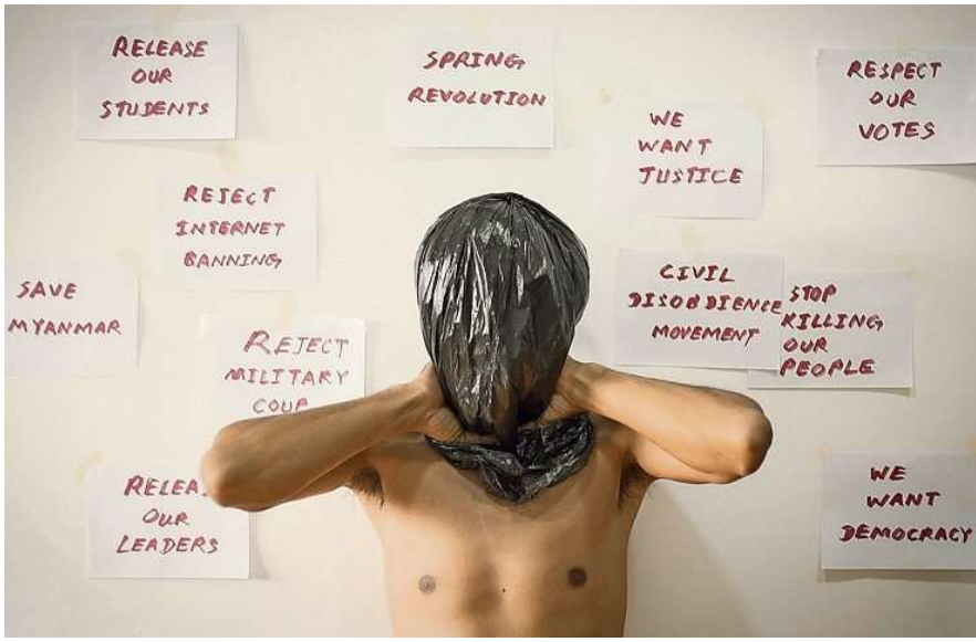
"Myanmar Diaries". THE MYANMAR FILM COLLECTIVE

diritti umani, specialmente quelli minacciati. Non poteva mancare un'attenzione particolare alla strettissima attualità: del conflitto in Ucraina parla il pluripremiato "Klondike" della regista Maryna El Gorbach, che racconta la storia di una famiglia nella regione del Donetsk. Ci sarà anche la prima svizzera del documentario "Myanmar Diaries", realizzato quest'anno da un collettivo di giovani registi birmani e premiato come miglior documentario alla Berlinale. fc